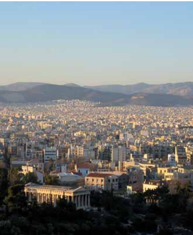
Blick von der Akropolis auf Athen

SMA liefert Energieversorgungen für eine der weltweit ersten U-Bahnen