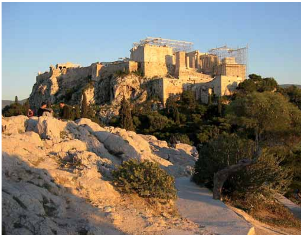
Die Akropolis in Athen