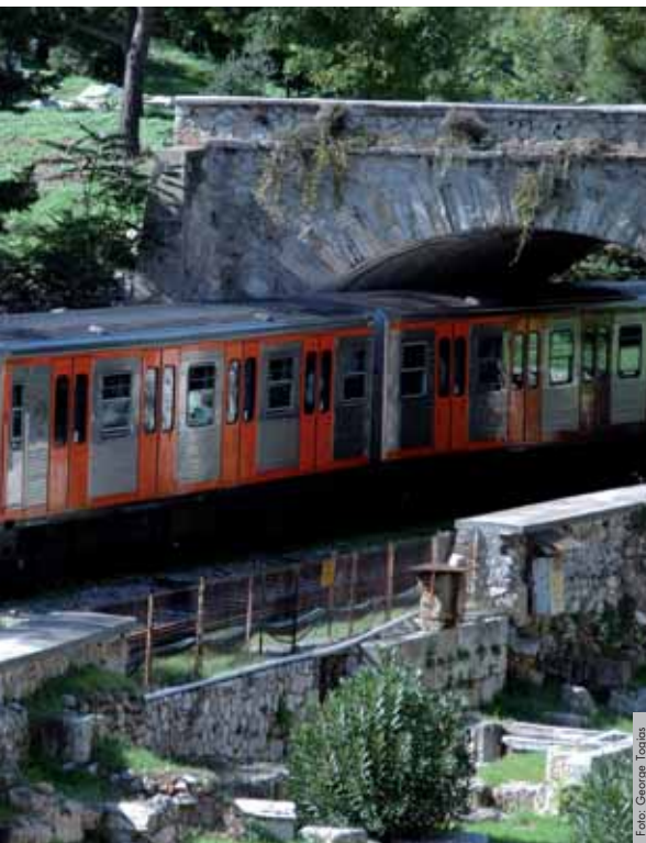
Ein Zug der ISAP während der Fahrt