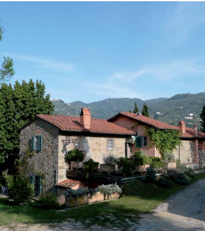
... und ausgeruht das Ziel erreichen.