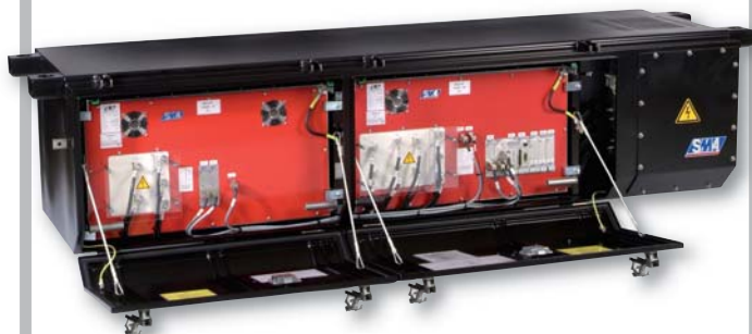
SMA Energieversorgungssystem MEE-NT LD