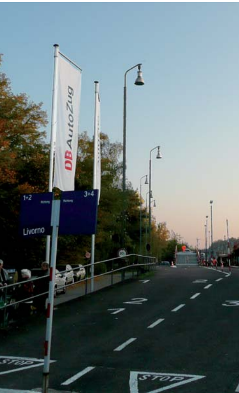
Abends mit dem ...

Das eigene Auto oder Motorrad ist für viele das bevorzugte Fortbewegungsmittel. Dies gilt gerade auch für den Urlaub, ermöglicht es doch die ungebundene Erkundung des Urlaubsorts und das vergleichsweise stressfreie Mitnehmen größerer Mengen von Gepäck.