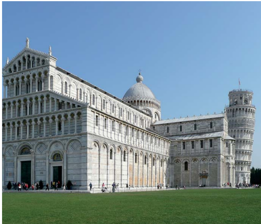
Der schiefe Turm von Pisa neben dem Dom